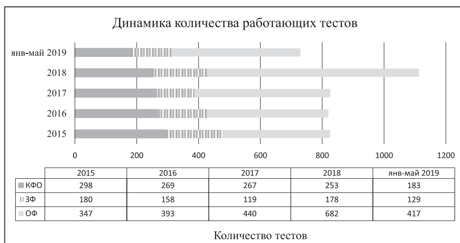
Рис. 4. Динамика роста используемых в учебном процессе тестовых контролирующих материалов

Работающие тесты – контролирующие материалы в тестовой форме, которые проходил хотя бы один студент указанного рабочего пространства.