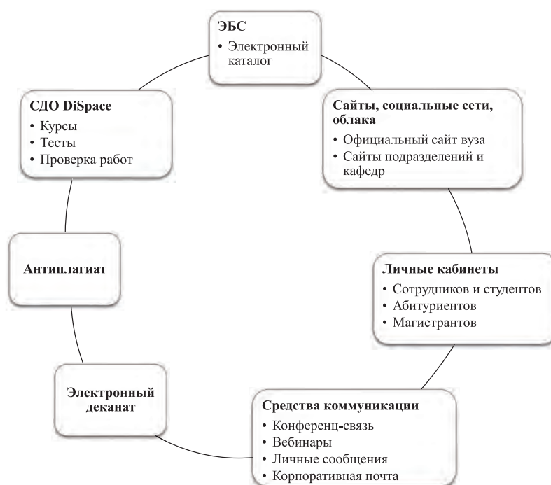
Рис. 1. Цифровая информационно-образовательная экосистема НГТУ

Цифровая информационно-образовательная экосистема НГТУ является открытой интегрированной многокомпонентной системой и включает организационное, кадровое и методическое обеспечение учебного процесса, а также программные, технические средства обработки и передачи информации, на основе которых создаются условия для эффективного совместного взаимодействия учебно-исследовательской, творческой и организационной деятельности обучающихся, преподавателей, служб сопровождения и др.