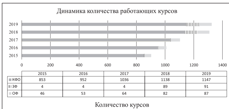
Рис. 3. Динамика роста работающих электронных курсов: КФО – комбинированное (смешанное обучение); ЗФО – заочное обучение; ОФО – очное обучение

В качестве обучающих объектов (цифровых образовательных ресурсов) в банке (хранилище) DiSpace 2.0 находятся спроектированные преподавателями электронные учебно-методические курсы, онлайн курсы, тесты, интерактивные тренажеры, а также учебные фильмы, анимация, лабораторные практикумы (в цифровом формате). На рисунках 3 и 4 показана динамика роста работающих цифровых образовательных ресурсов в НГТУ с 2015 г. по середину 2019 г. Работающими авторы называют электронные курсы, используемые в учебном процессе с удаленным доступом (различные модели смешанного, дистанционного обучения).