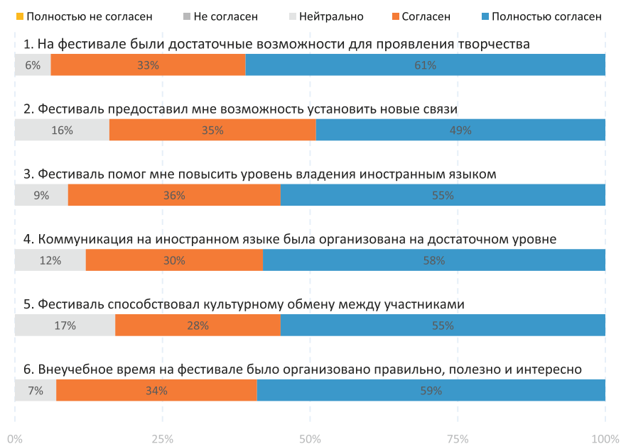
Рис. 2. Результаты анкетирования русскоязычных студентов по шкале Лайкерта Fig. 2. The results of the survey of Russian-speaking students on the Likert scale

В целом полученные результаты свидетельствуют о том, что иностранные студенты в значительной степени положительно воспринимают различные аспекты студенческого фестиваля. Фестиваль эффективно способствует реализации творческого потенциала, социальной интеграции, расширению социального взаимодействия и межкультурному обмену. Результаты также указывают на формирование эффективной среды для языковой коммуникации и высокую оценку организации внеучебной деятельности.